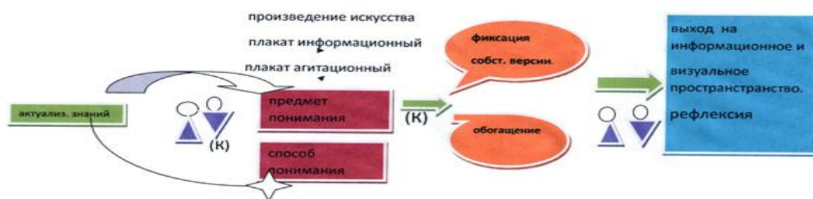
Схема описанной технологии или ее фрагмента в том виде, в котором она реализуется в сценарии:

Этапы занятия, необходимые для освоения единицы содержания по данному сценарию: