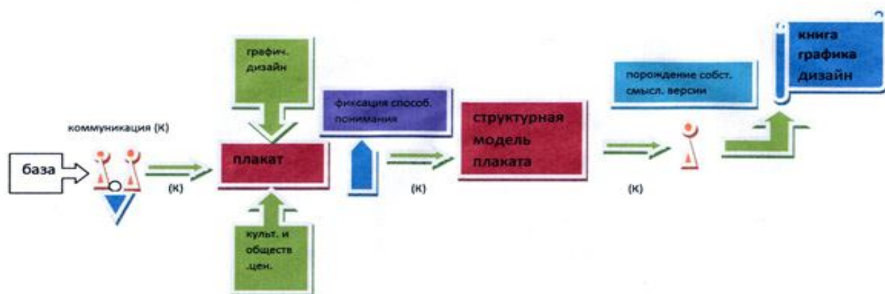
Схема системы единиц с указанием в ней места осваиваемой единицы: